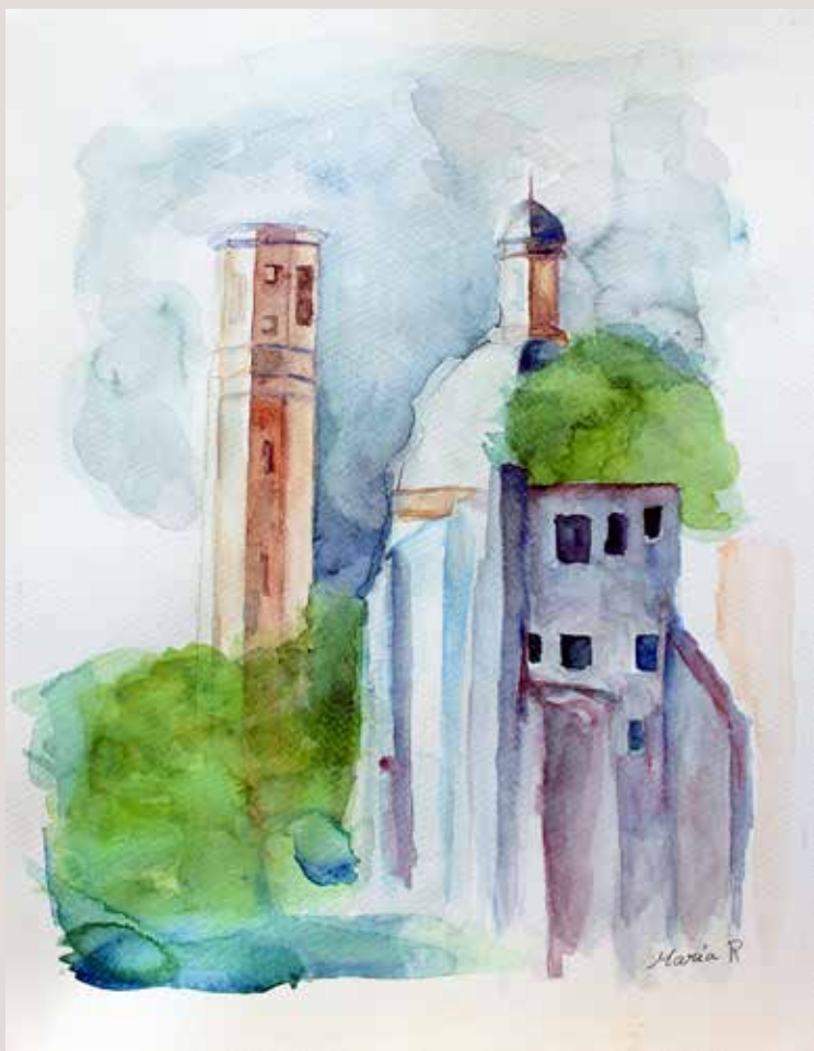
MARIA RODRÍGUEZ PÉREZ. Vistes PLaceta Les Eres . Aquarel·la sobre paper. 27 x 35