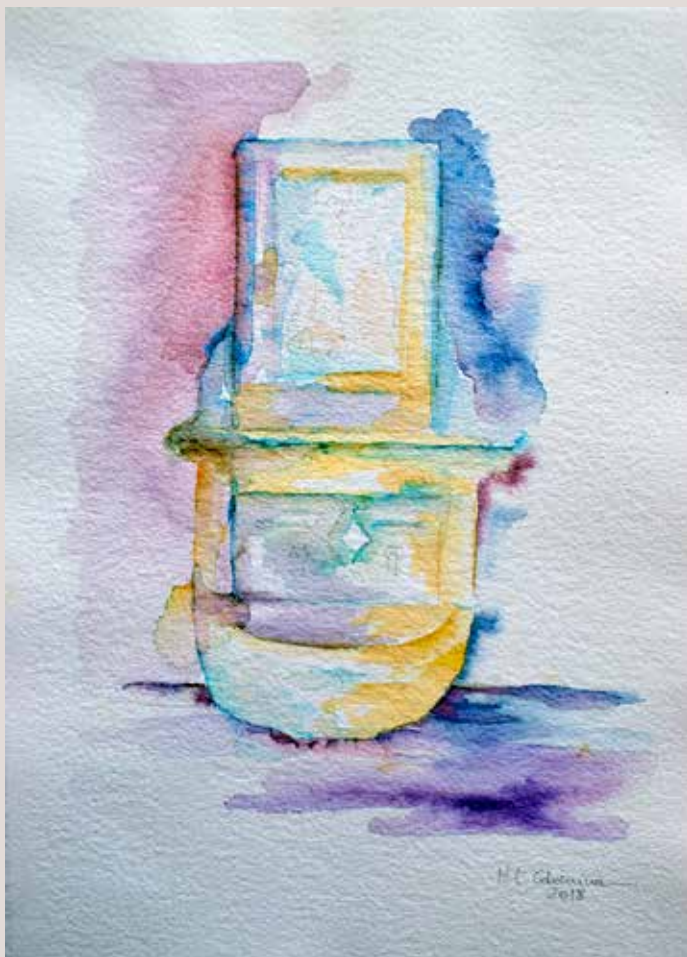
LUISA COLOMINA VALOR. Fonteta . Aquarel·la sobre paper. 21 x 30