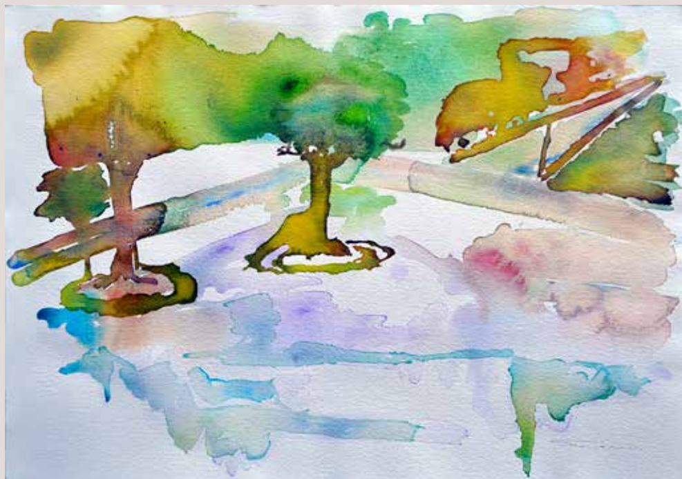
SUSANA ALEMANY FUENTES. Vistes Font Roja . Aquarel·la sobre paper 50 x 35.5