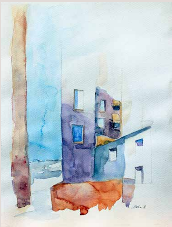
MARIA RODRÍGUEZ PÉREZ Santo Tomás . Aquarel·la sobre paper. 27 x 35