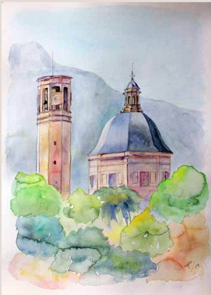
MARIBEL VALOR TORREGROSA. Sant Maure . Aquarel·la sobre paper. 30 x 40