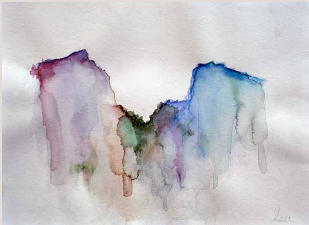
JUDITH DÍEZ FERNÁNDEZ. Barranc del Cint . Aquarel, la sobre paper. 40 x 30