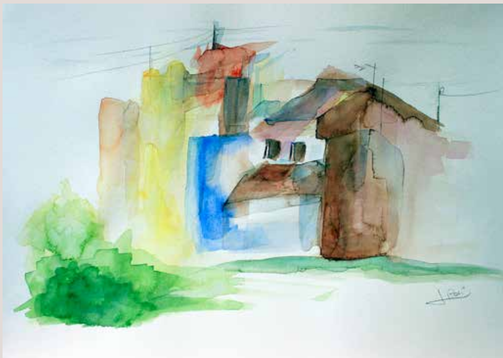
ROSI LLORENS PALASI. Placeta Les Eres . Aquarel·la sobre paper. 40 x 30