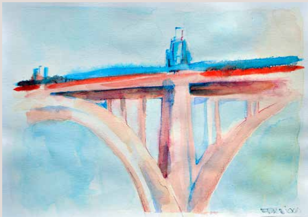
FABIOLA PASCUAL VILAPLANA. Pont Sant Jordi . Aquarel·la sobre paper. 50 x 36