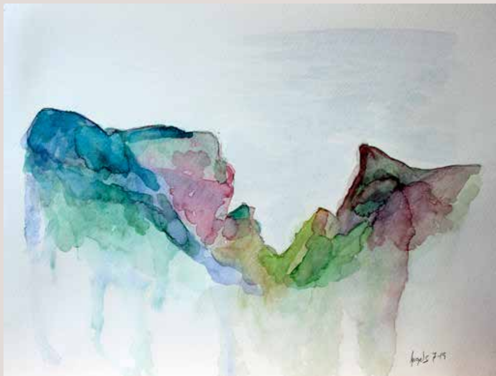
ÀNGELS LLÀCER GISBERT. La llar dels voltors . Aquarel·la sobre paper. 35 x 27