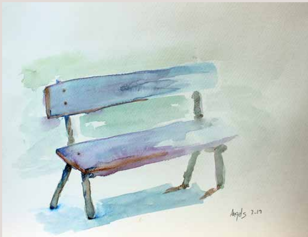
ÀNGELS LLÀCER GISBERT. Detall banc . Aquarel·la sobre paper. 35 x 27