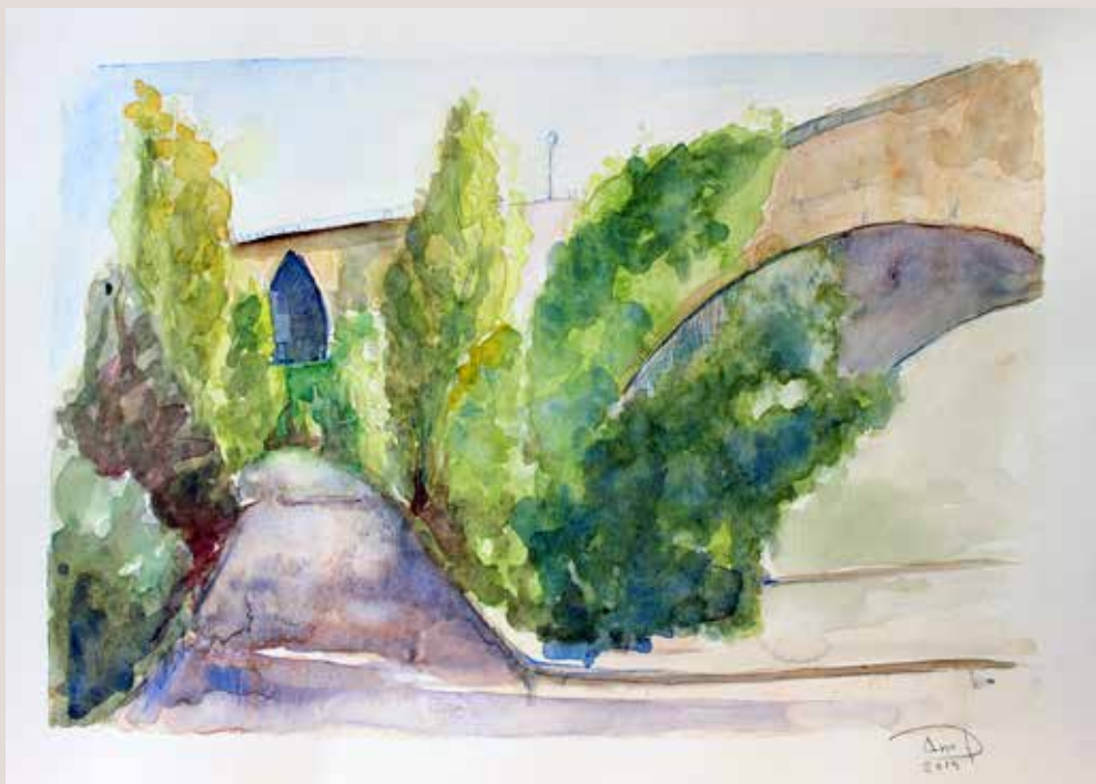
ANA ROSA PAYÀ PÉREZ PLÀ. Pont Cervantes . Aquarel·la sobre paper. 40 x 30