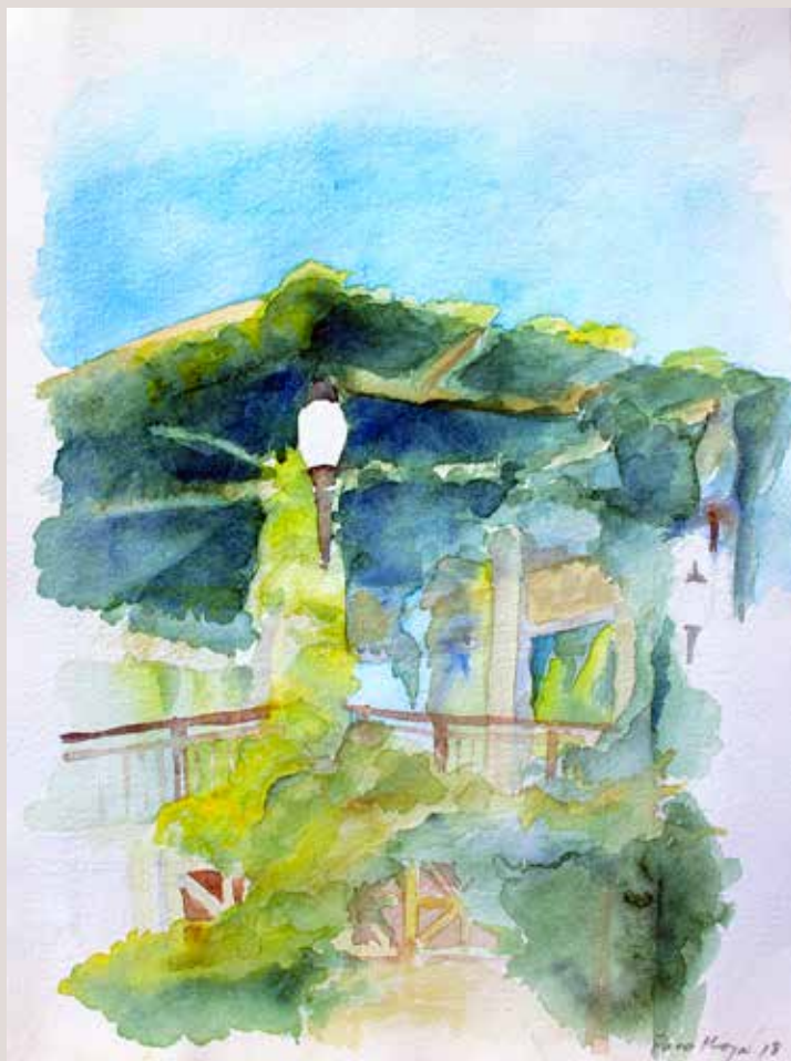
PACO MOYA PÉREZ. La Glorieta . Aquarel·la sobre paper 28 x 21