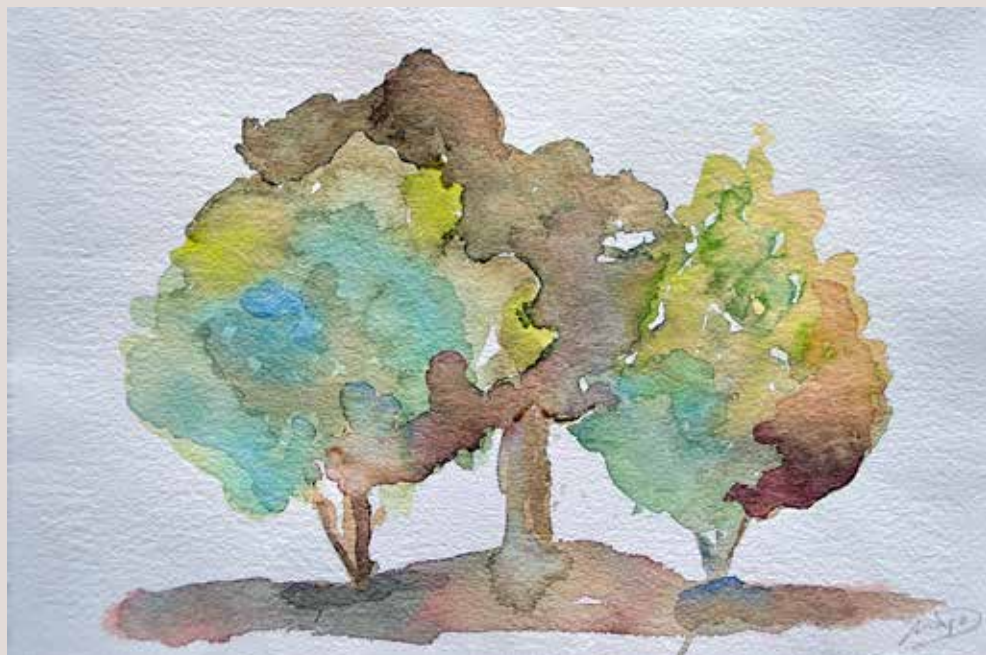
MAJO DÍAZ MONTAVA. Font Roja II . Aquarel·la sobre paper 30 x 20