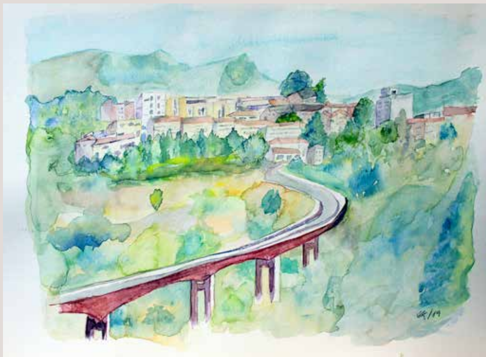
MARIBEL VALOR TORREGROSA. Pont Francisco Aura Boronat . Aquarel·la sobre paper. 40 x 30