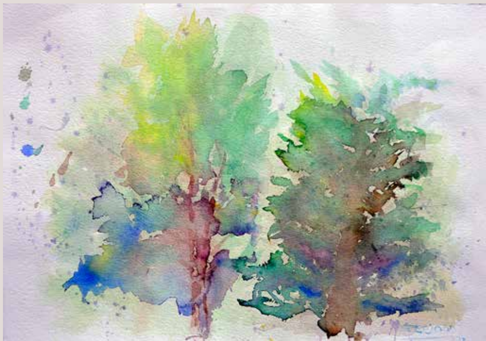
FABIOLA PASCUAL VILAPLANA. Arbres . Aquarel·la sobre paper. 50 x 36