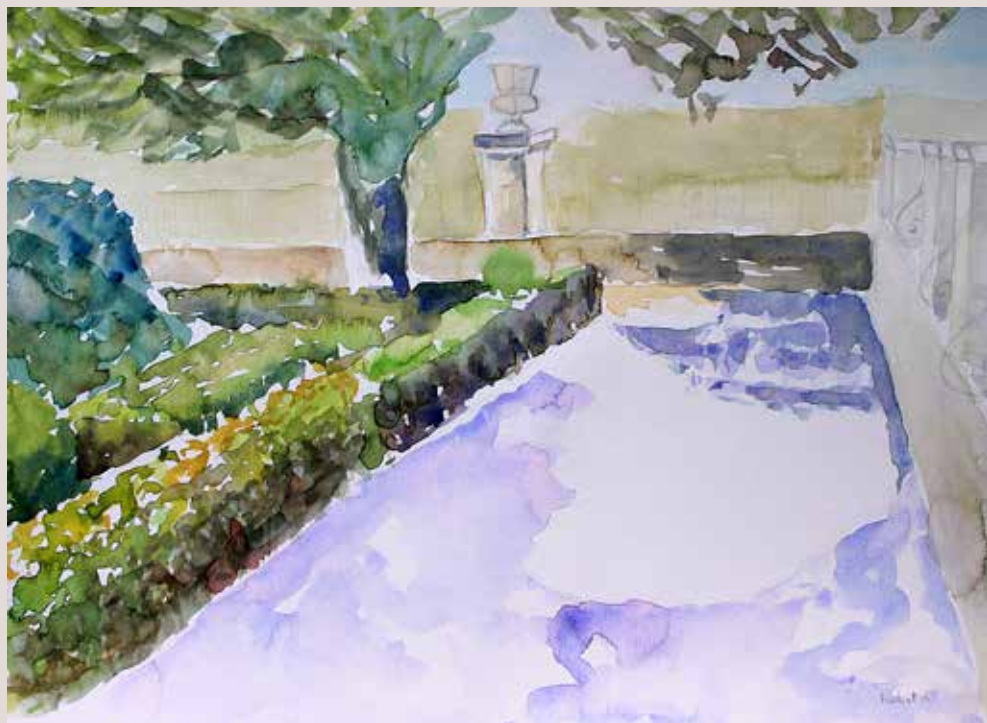
ISABEL ARACIL MERLATEAU. "Jardín de Santos" I. Aquarel·la sobre paper. 40.5 x 30