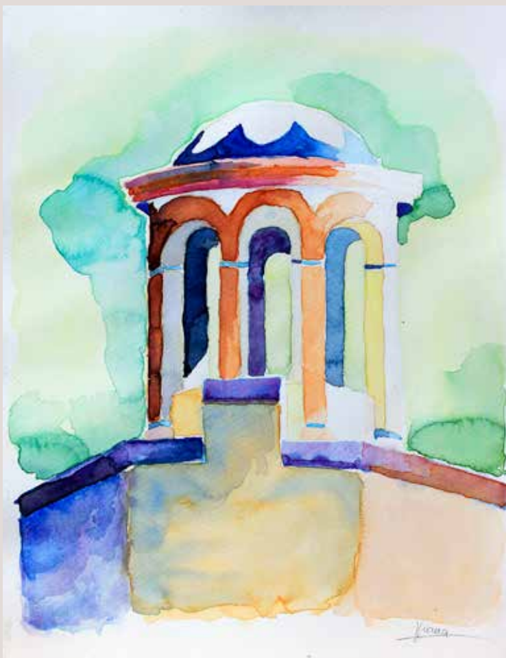
DIANA FERRER CABRERA. Colors del Molinar . Aquarel·la sobre paper 20 x 30