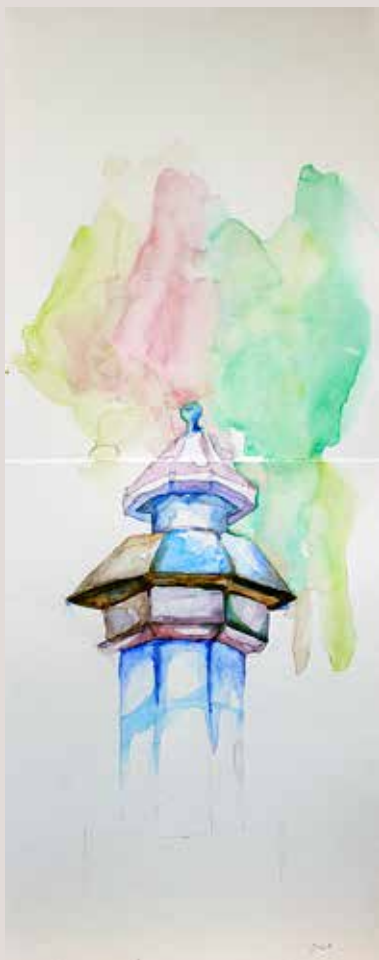
JÚLIA BARCELÓ CASTELLÓ. L'estany de La Glorieta . Aquarel·la sobre paper. 62 x 20