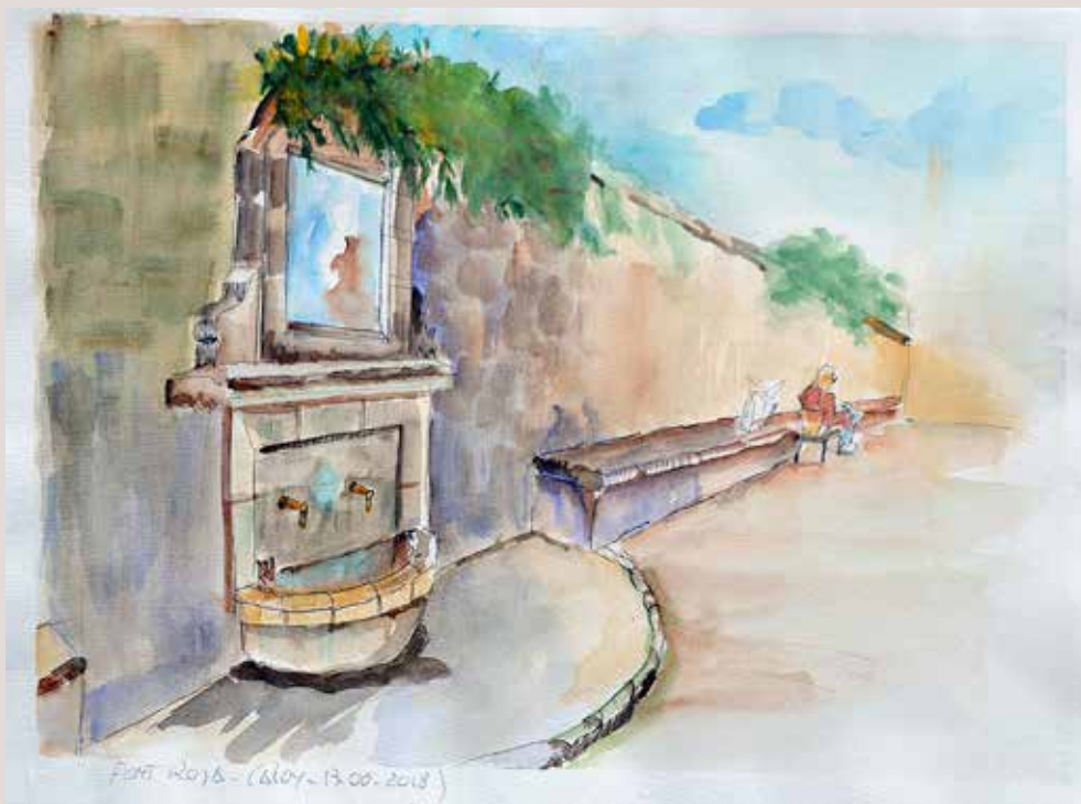
GEMA SEMPÈRE MOLINA. Paco en la Font Roja . Aquarel·la sobre paper 45.5 x 32