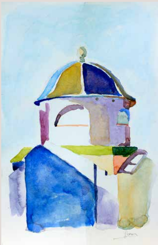
DIANA FERRER CABRERA. Cúpula . Aquarel·la sobre paper. 27 x 35