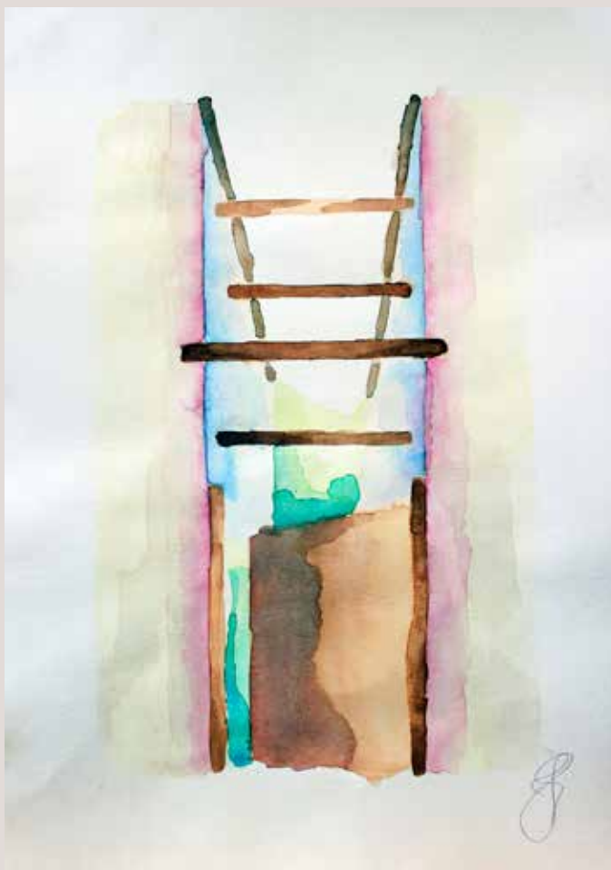
IRENE JORDÀ CASTELLÓ. Fàbriques del Molinar . Aquarel·la sobre paper 29.5x40.5