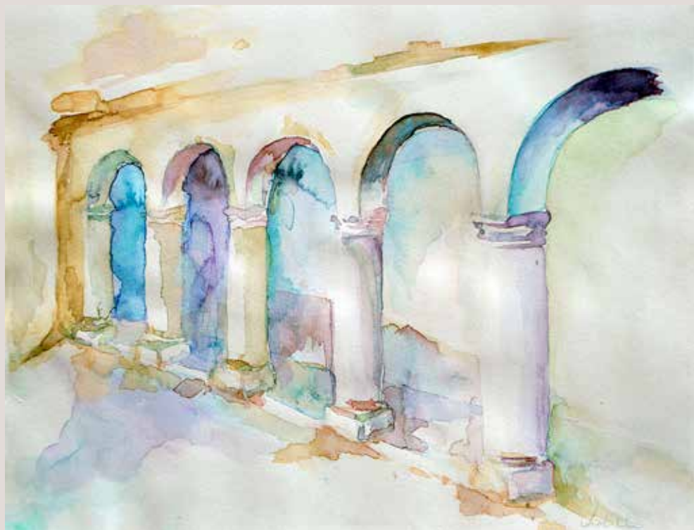
JUDITH DÍEZ FERNÁNDEZ. Museu . Aquarel, la sobre paper. 40 x 30