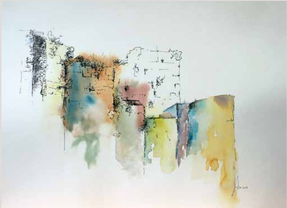
AURORA MOURELLE MORALES. Ruines . Aquarel·la sobre paper. 40 x 30