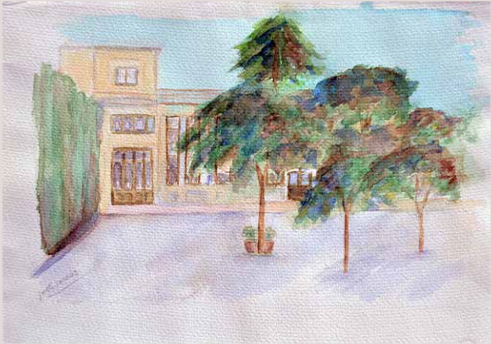
JORDI LLORENS NAVARRO. Círcul Industrial . Aquarel·la sobre paper. 35 x 25