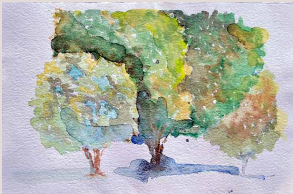
MAJO DÍAZ MONTAVA. Font Roja I . Aquarel·la sobre paper 30 x 20