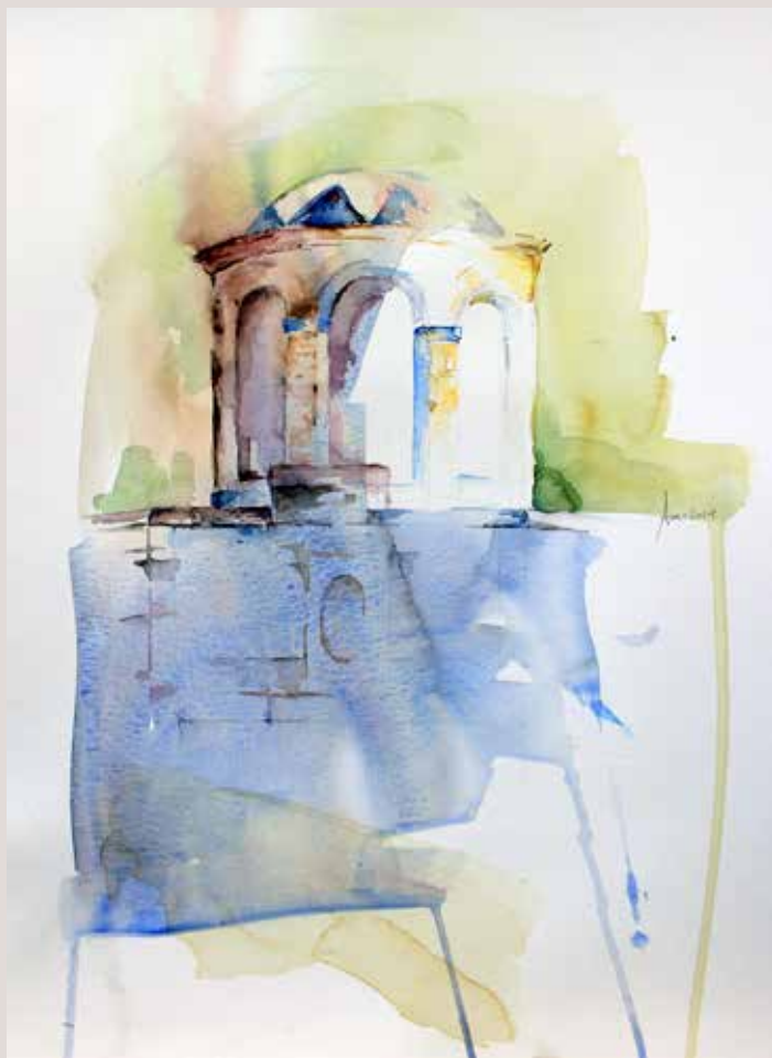
AURORA MOURELLE MORALES. El Molinar . Aquarel·la sobre paper. 30 x 40