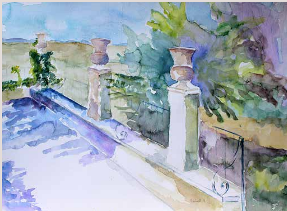
ISABEL ARACIL MERLATEAU. “Jardín de Santos” II. Aquarel·la sobre paper. 40.5 x 30