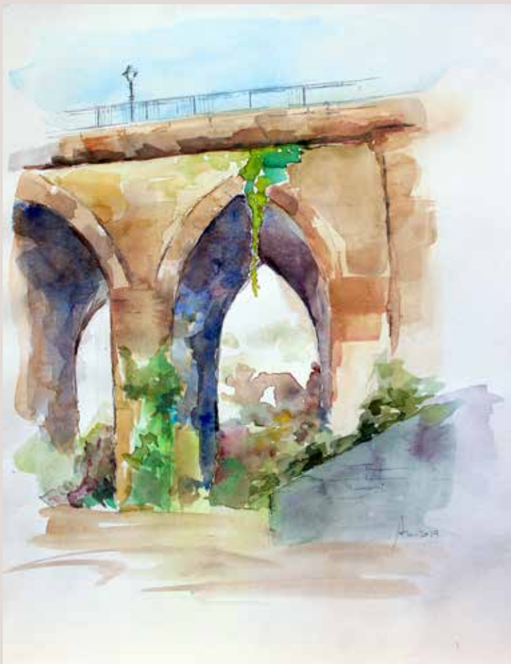
AURORA MOURELLE MORALES. Pont de Maria Cristina . Aquarel·la sobre paper. 27 x 35