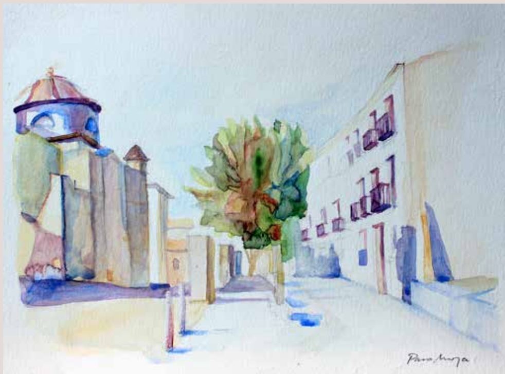
PACO MOYA PÉREZ. Verge Maria . Aquarel·la sobre paper 28 x 21