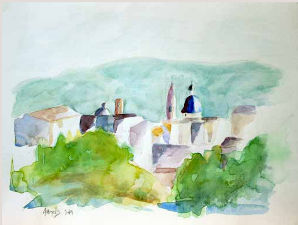
ÀNGELS LLÀCER GISBERT. El Centre d'Alcoi . Aquarel·la sobre paper. 35 x 27