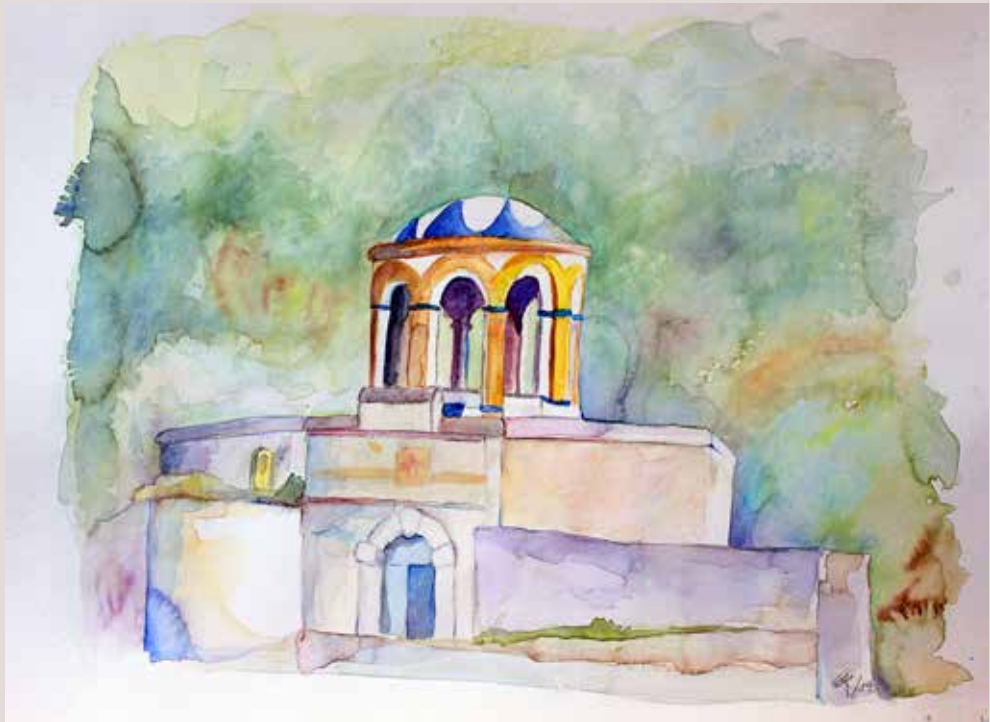
MARIBEL VALOR TORREGROSA. Vistes Molinar . Aquarel·la sobre paper. 40 x 30