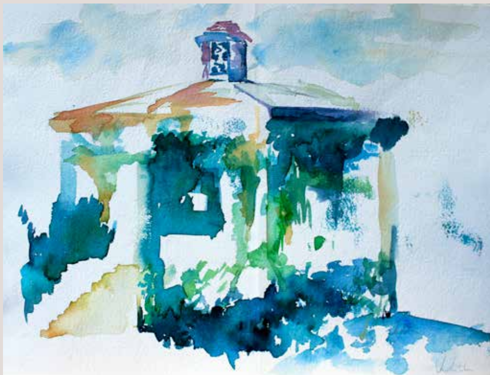
JUDITH DíEZ FERNÁNDEZ. Templet . Aquarel, la sobre paper. 40 x 30