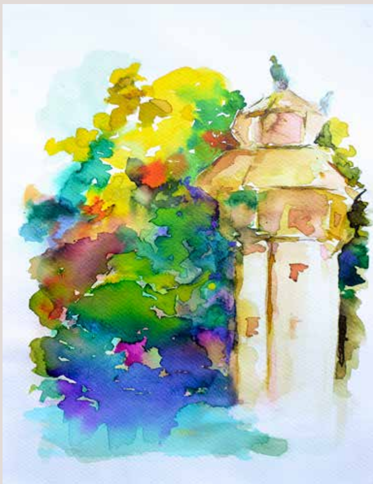
AURORA MOURELLE MORALES. Ocellaire . Aquarel-la sobre paper. 27 x 35