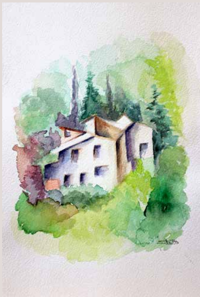
STELLA PICÓ JOAN. Caseta . Aquarel·la sobre paper. 20 x 30