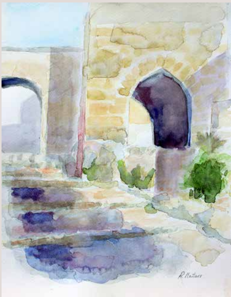
ROSA M a . MARTÍNEZ ESTEVE. Torre Navadora . Aquarel·la sobre paper 27 x 35